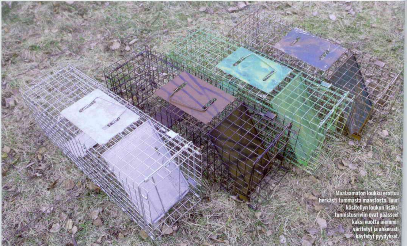
Maalaamaton loukku erottuu herkästi tummasta maastosta. Juuri käsitellyn loukun lisäksi tunnistusriviin ovat päässeet kaksi vuotta aiemmin väritetyt ja ahkerasti käytetyt pyydykset.