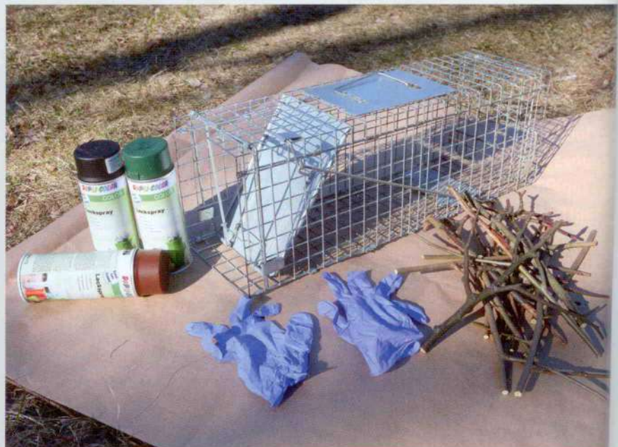
Spraymaalien korkit kertovat maalin sävyn. Mattapintainen maali on kiiltävää parempi vaihtoehto. Kertakäyttösormikilla loukku on helppo käänellä maalauksen aikana. Suojapaperi estää maalia leviämässä alust ja roskia tarttumasta tuoreeseen maalipintaan. Viereen on pätkitty kasa oksia kuviointimaalausta varten.

Pyydykset kannattaa piilottaa mahdollisimman hyvin ulkopuolisten katseilta.